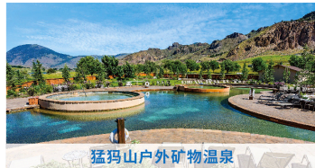
猛玛山户外矿物温泉