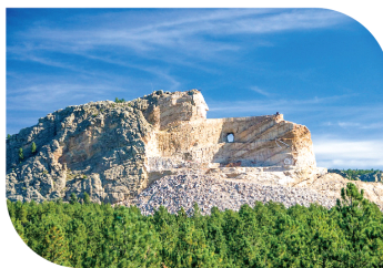
*另需额外加收$5/人/天燃油附加费。 价格、行程、出团日期等具体内容有可能改变, 恕不提前通知。