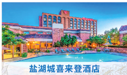
盐湖城喜来登酒店