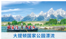
大提顿国家公园漂流